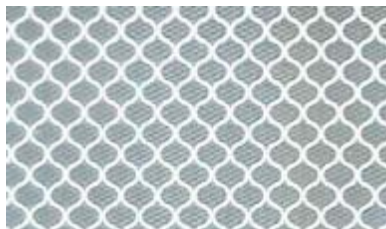
Abbildung 1 - Zellenstruktur und Verarbeitungsrichtungen

ORALITE® 6910 Brilliant Grade ist erhältlich in den Farben Weiß (010), Gelb (020), Orange (035), Rot (030), Grün (060) Blau (050) und Braun (080) sowie in den fluoreszierenden Standardverkehrsfarben Gelb fluoreszierend (037), Gelb-grün fluoreszierend (029) und Orange fluoreszierend (038). Die Tagesaufsichtsfarben, gemessen gemäß den einschlägigen Spezifikationen der CIE Nr. 15.2, entsprechen Tabelle 3 und 4 und sollen die Werte gemäß DIN 6171-1: 2011-11 erfüllen. Zu Informationszwecken werden auch die fluoreszierenden Leuchtdichtefaktoren angegeben.