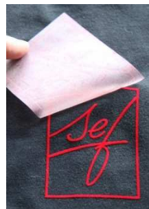
Trägerfolie abziehen, fertig!

VelCut Evo ist mit Viskoseflock in 22 Farben beflockt. Dieselben Farben sind auch in Transflock verfügbar, so dass sich große Auflagen an Flocktransfers, mit Transflock konventionell im Siebdruck hergestellt, perfekt mit Flocktransfers aus VelCut Evo kombinieren lassen. Für größere Auflagen steht auch die stanzfähige Variante DIE-CUT p-bac in den gleichen Farben zur Verfügung. VelCut Premium ist mit Polyamidflock in vier Fluorfarben erhältlich.